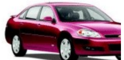
Avis Categoría E