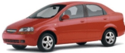
Avis Categoría A